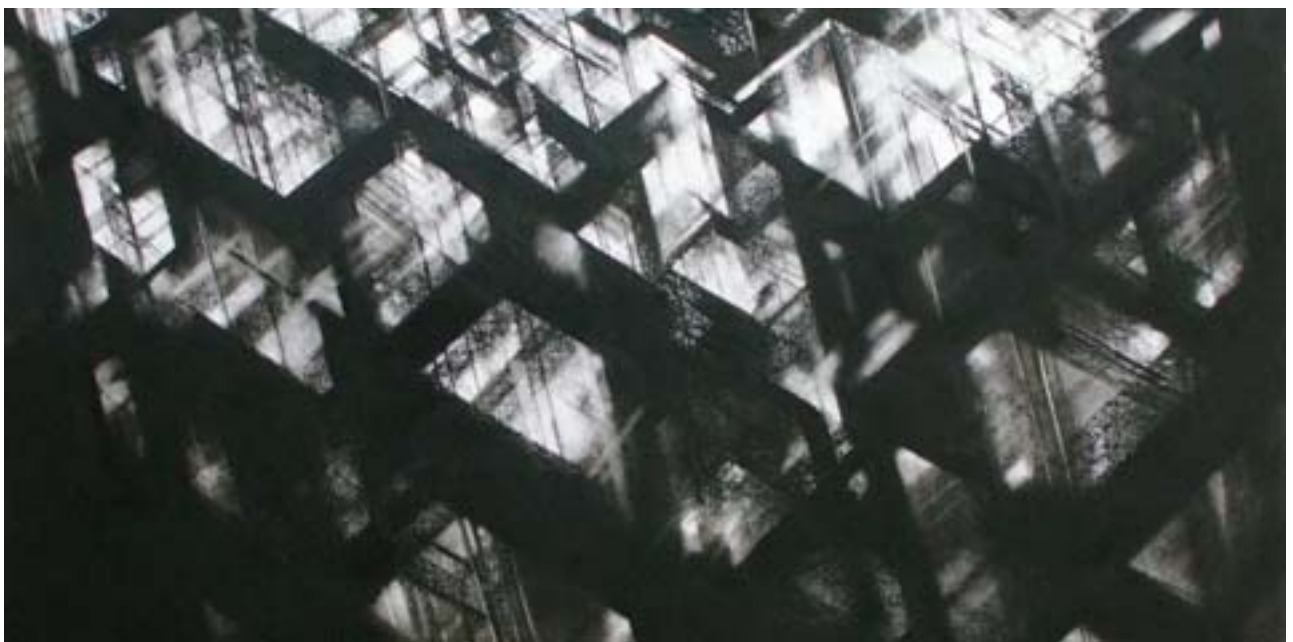
Surplomb (détail), pastel sec, 100 x 100 cm, 2009