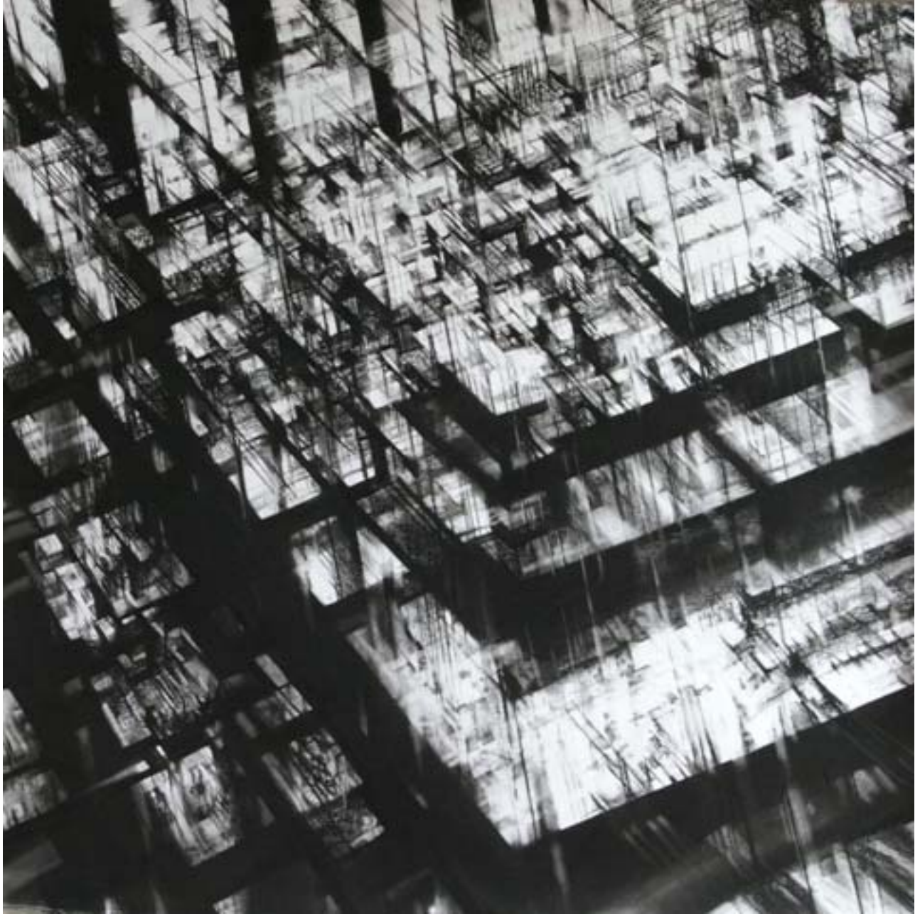
Cité interdite, pastel sec, 100 x 100 cm, 2009