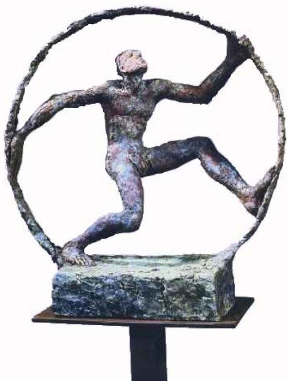
« Faust » - Bronze - 26 x 24 x 10 cm