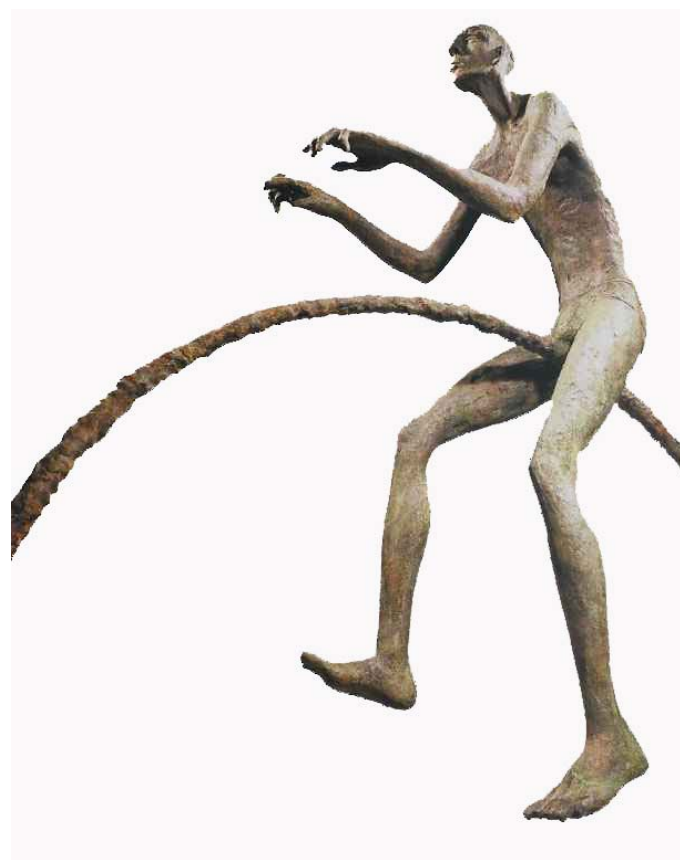
« Bicycle » - Bronze - 170 x 130 x 41 cm