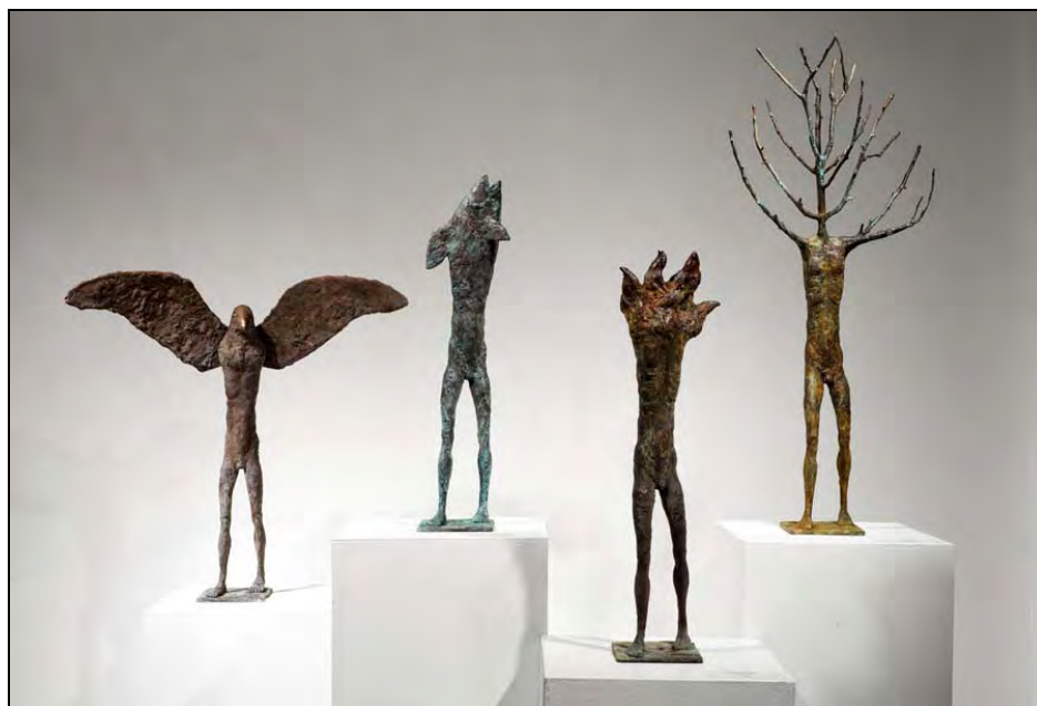
« Les 4 éléments » - Bronze